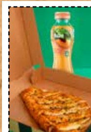
Prix hors fuzetea

6 pilons de poulet marinés et rôtis au four & sauce BBQ.